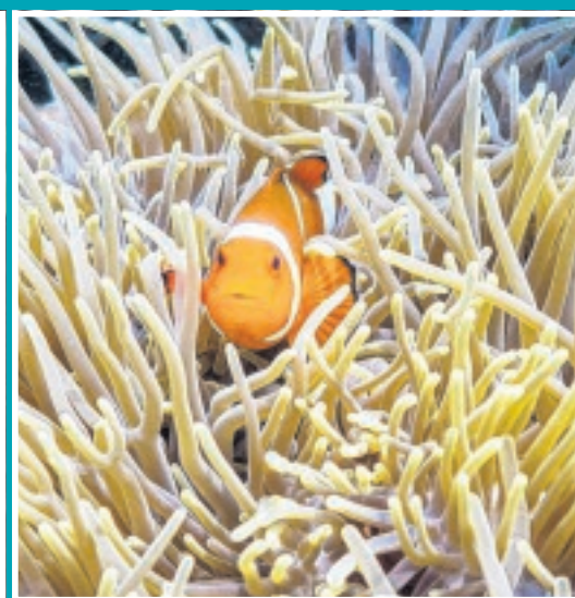
Orangs-outans et éléphants dans le nord de l'île de Sumatra. Tarcus sur l'île de Belitung. Poisson-clown se cachant dans une anémone de mer. Les îles indonésiennes recèlent des trésors naturels.